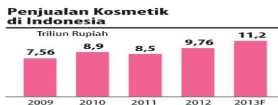
Gambar 1 Perkembangan Penjualan Kosmetik di Indonesia

Pasca terjadi krisis global tidak hanya memberikan dampak negatif terhadap dunia industri di Indonesia. Krisis global di bidang ekonomi pada tahun 2012 yang menyebabkan perlambat pertumbuhan ekonomi nasional, namun Indonesia mampu bertahan dari krisis global dengan terus mengalami pertumbuhan yang solid. Perusahaan Kosmetik Indonesia (PERKOSMI) memproyeksikan bahwa sejalan dengan berkembangnya secara cepat tentang informasi dan ilmu pengetahuan teknologi yang mempermudah dalam pembelajaran tentang penggunaan kosmetik melalui media sosial.