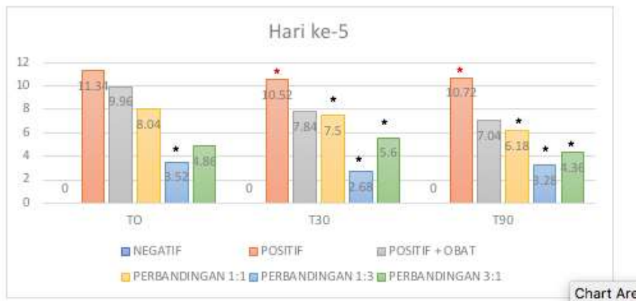
Gambar 3. Grafik presentase perubahan hiperurisemia hari ke-5