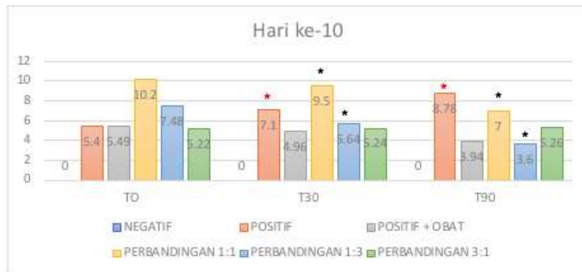
Gambar 5. Grafik presentase perubahan hiperurisemia hari ke-10