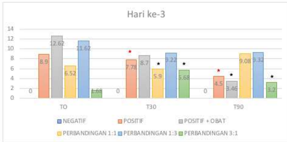
Gambar 2. Grafik presentase perubahan hiperurisemia hari ke-3