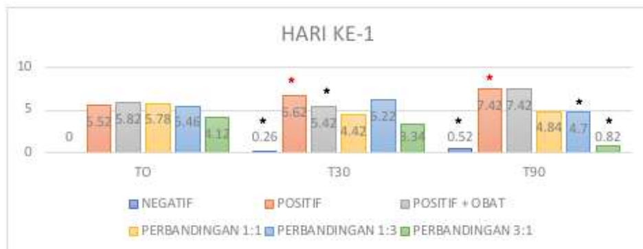
Gambar 1. Grafik presentase perubahan hiperurisemia hari ke-1

Uji efek antihiperurisemia darah mencit dilakukan pada hari ke 1, 3,5,7,10 dan 14 hari. Setelah diberikan induksi kalium oksonat 300 mg/kgBB, semua hewan uji diukur kadar asam uratnya. Satu jam setelah pemberian kalium oksonat 300 mg/kgBB diberikan sediaan ekstrak kombinasi dosis 125/25mg/kgBB, 125/75mg/kgBB, dan 375/25 mg/kgBB, dan diukur kembali kadar asam urat nya pada menit 30 dan 90, pada kelompok pembandingan diukur kadar asam urat nya satu jam setelah pemberian kalium oksonat 300 mg/kgBB kemudian dilanjutkan dengan pemberian allopurinol dan diukur kadar asam urat nya pada menit ke 30 dan 90. Pengukuran kadar asam urat darah dilakukan dengan menggunakan strip test yang telah dipasang pada Easy Touch , dimana kadar asam urat darah akan terbaca dalam waktu 10 detik. Data hasil penelitian ini di analisa menggunakan Two Way Anova dengan tingkat kepercayaan 95%.