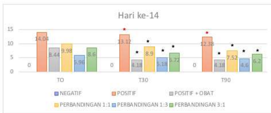
Gambar 6. Grafik presentase perubahan hiperurisemia hari ke-14

Keterangan : *: ( p < 0,05 ) dibandingkan dengan kelompok pembanding * : ( p < 0,05 ) dibandingkan dengan kelompok induksi